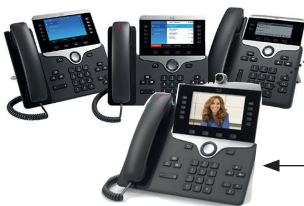
Cisco IP Telefon 7800 Serie Cisco IP Phone 8800 Serie (optionaler Systemtelefonadapter)