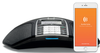
KONFTEL 300IPx Optionaler Anschluss: USB

Cisco ist ein führender Anbieter von Lösungen im Bereich der Unified Communications and Collaboration (UCC), von Cloud-Diensten und anderen Anwendungen. Konftel verfolgt die Strategie, Produkte für die führenden Kommunikationsplattformen auf dem Markt zu optimieren und zu zertifizieren.