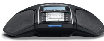
KONFTEL 300Wx Optionale Anschlüsse: USB, Smartphone