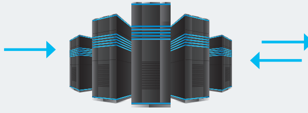
KONFTEL ZTI SERVICE

1 Kund registrerar Konftel 300IP/300IPx (MAC adress och serie nummer) på ZTI portalen.